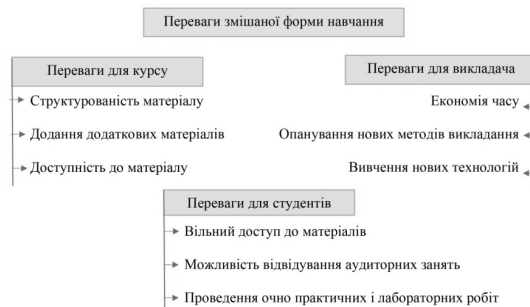
Рис. 4. Основні переваги змішаної форми