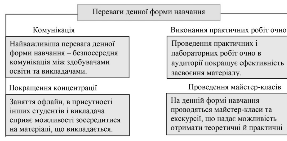
Рис. 3. Основні переваги денної форми