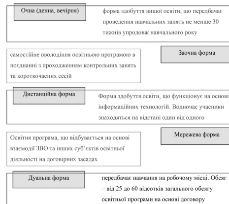
Рис. 1. Форми здобуття вищої освіти (на підставі [1])

Протягом тривалого часу серед науковців ведуться постійні дискусії з питання обрання найкращих форм освітнього процесу. Одні схиляються до вибору традиційної форми навчання, інші ж пропонують застосовувати тільки дистанційну форму, виходячи з реалій часу. Але зовнішні умови, що вплинули на суспільство, самі вирішили це питання, і в 2020 р., коли почалася пандемія коронавірусу, всі заклади освіти перейшли на дистанційну форму навчання задля сприяння безпеці учасникам навчального процесу та для запобігання поширення вірусу серед всього населення. Така форма навчання тривала в Україні протягом двох років, але 24 лютого 2022 р. все знову змінилося через початок повномасштабної війни в країні.