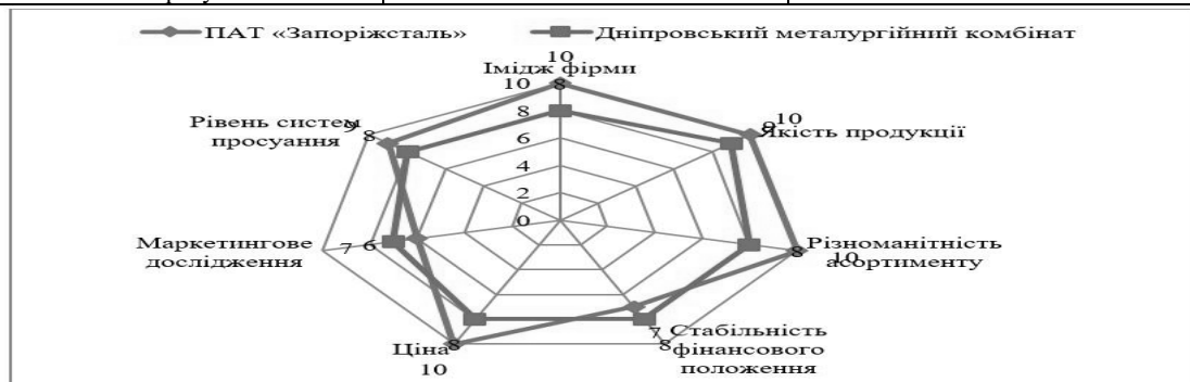
Рис. 1 Багатокутник конкурентоспроможності ПАТ «Запоріжсталь» (власна розробка автора)

У конкуренції дуже велике місце займає реклама, оскільки саме завдяки їй збільшується потік клієнтів. Далі доцільно провести аналіз конкурентоспроможності методом бенчмаркінгу на основі побудови квадрату потенціалу для ПАТ «Запоріжсталь» та Дніпровський металургійний комбінат (табл. 3). Та на основі зібраних даних визначимо підприємство з найбільшим потенціалом. Дані за підприємствами, тобто ранги проставлялись експертами, залежно від потенціалу кожної компанії, максимальний ранг 2, адже є два підприємства. Наступним проведемо розрахунок показників табл. 4.